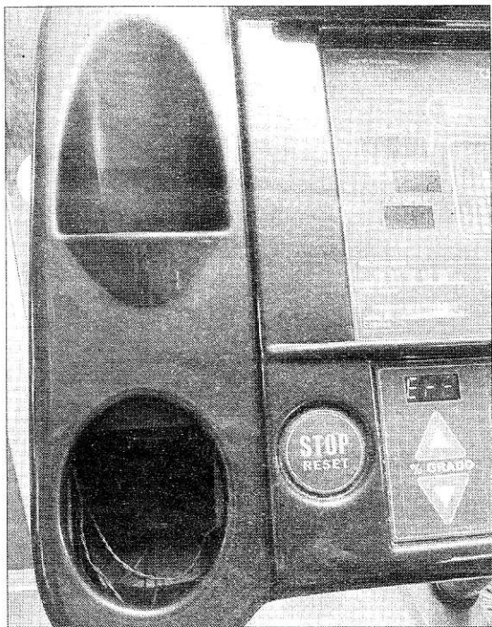
Algunos aparatos del centro o no funcionan o no se pueden utilizar a pleno rendimiento LEVANTE-EMV