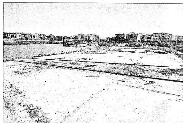
La explanada donde se ubicará el chiringuito de Playa Varadero.