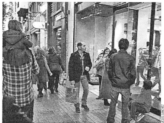
La calle Colón es la más cara en alquileres comerciales de Valencia.

Para Gómez-Pantoja los polideportivos no son una competencia de los ayuntamientos: "Deberían centrar sus esfuerzos en acciones prioritarias que favorezcan la creación de empleo, la educación y la sanidad".