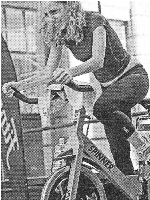
Los centros deportivos privados denuncian que existe competencia desleal.

polideportivos locales ofertan servicios deportivos por debajo de su coste, a precios ridículos, que no permiten competir a las entidades privadas. Y aunque los precios se hayan subido, esta circunstancia no ha cambiado y no se ha eliminado la competencia desleal". Además, según Gómez Pantoja, las concesionarias no están pagando la cuota al Ayuntamiento.