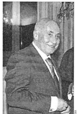
El Síndic de Greuges, José Cholbi.

E.P./ El Síndic de Greuges tramitó en 2010 un total de 9.504 quejas, lo que supone un 160% más respecto a 2009. De ellas, 1.541 se refieren a la obtención de las ayudas de la Ley de la Dependencia. El defensor del pueblo valenciano asegura que existen muchos dependientes que, tras esperar más de tres años, todavía no han comenzado a percibir ayudas. También crece el número de consultas recibidas: 11.742, casi el doble que en 2009.