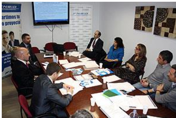
Asamblea General Ordinaria y Junta Directiva de FNEID